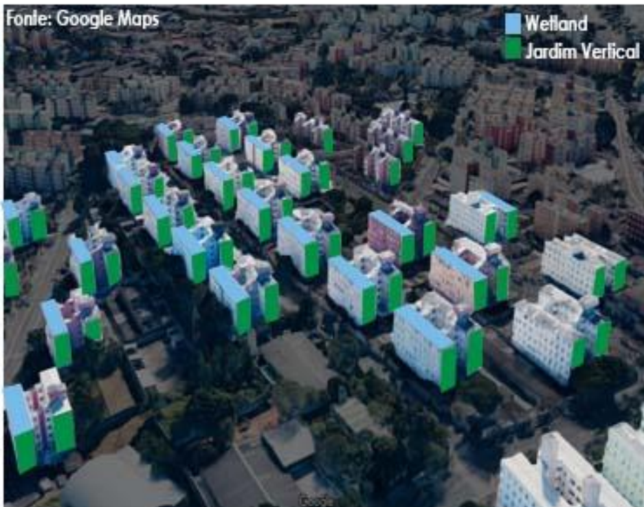
COHAB Itaquera Conjunto Padre Manoel de Nóbrega